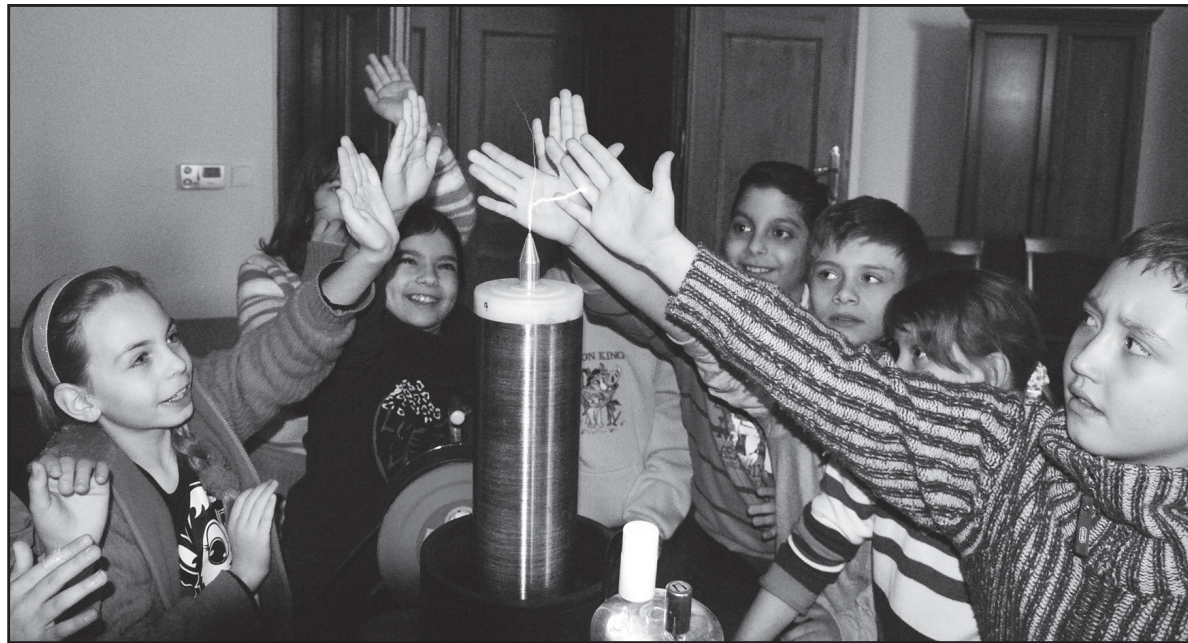
Fyzikální pokusy pro menší školáky. Kdo si chce sáhnout na blesk? Já, já, já! předháněly se děti z 3. B. ze ZŠ Budovatelů.

Výstava Hry a klamy nainstalovaná v rytířském sále Červeného hrádku představuje desítky exponátů, které zábavnou formou vysvětlují či znázorňují některé fyzikální jevy. Projevují o ni zájem především školy z okolí. Od půlky ledna, kdy byla výstava otevřena, ji zhlédlo přes osmnáct set návštěvníků a zas prvních deset únorových dní téměř stejně tolik.