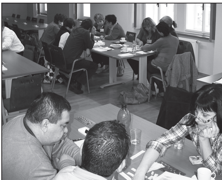
Jednání zástupců agentury a lokálních partnerů probíhalo v zasedačce radnice.

Vzdělávání: K úspěšnému přípravě ročníku na 1. ZŠ přibyla nová „přípravka“ na 3. ZŠ a byla podpořena spolupráce s místními subjekty. Jedná se o jedno z nejučinnějších opatření při vyrovnávání startovací čáry dětí. I proto byl výrazněji propagován zápis do mateřských škol, které tento cíl mohou plnit ještě výrazněji. Městský ústav sociálních služeb ve spolupráci se všemi