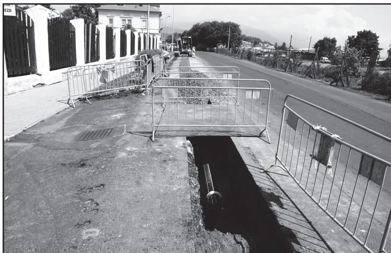
▲ Rekonstrukce Chomutovské ulice ▶ Vrtání studny u Kludského vily