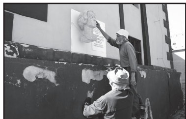
Příprava instalace busty F. Brokofa