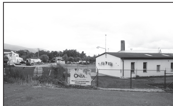
◀ Místo výběru parkovného ▲ sídlo firmy ONZA.

mandátní smlouvu o správě, provozování a údržbě veřejných pohřebišť v Jirkově a Březenci, a to s platností od 1. června.