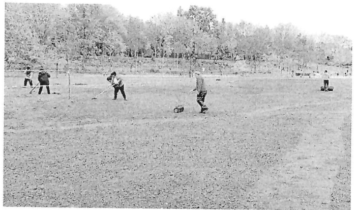
Úprava terénu a výsadba nového trávníku v Olejomylnském parku.

způsobem hodlá vedení města zarostlé a nepřístupné lokality otevřít lidem, aby neměli pocit, že se musí pohybovat jen po chod-