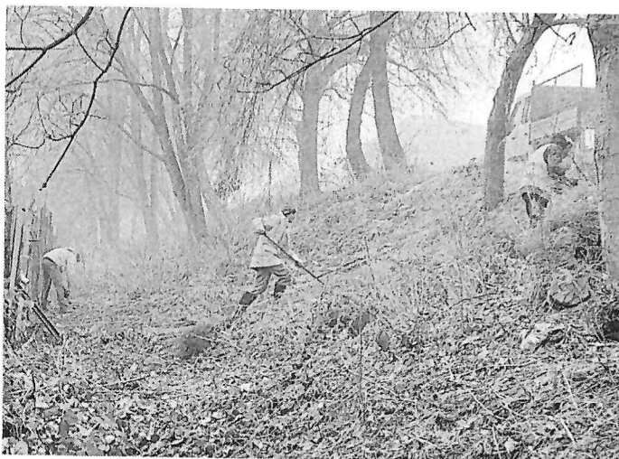
Pracovníci firmy Onza při nedávném čištění letitého neudržovaného prostoru před zahrádkami v ulici Na Stráni.

Krušnohorská – to vše bude na jaře doděláno. Také odtud zmizí ploty, aby tudy mohli občané procházet. V těchto dnech se dokončuje prostor pod Domovem pro seniory na Mládežnické, kde vzniká velké parkoviště, a na jaře se zde budou dělat sadové úpravy. V ulici Na Stráni jsme v těchto dnech vyčistili a prosvětlili svah k místním zahrádkám. K těmto pracím využíváme zimní měsíce, kdy není sníh a je sucho. A budeme to dělat i na dalších místech. Na podzim chceme pokračovat v čištění území od Krátké ulice směrem na Krušnohorskou a k obchvatu. Tímto