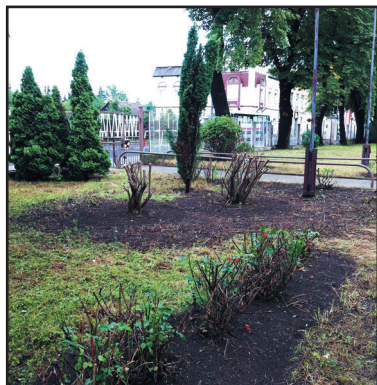
Úpravy areálu se ujala městská sociální firma ONZA

Město tento zájem vítá, jednak se sníží náklady na údržbu budovy, jednak se tak podaří naplnit dlouhodobé úsilí současného vedení města o zřízení střední školy v Jirkově. Proto vyšlo žádosti vstříc a dělá kroky potřebné k tomu, aby škola zahájila provoz od září.