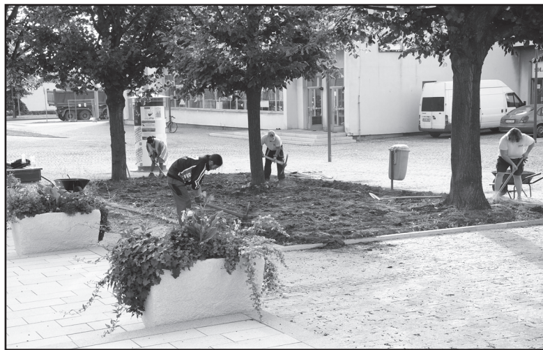
Počátkem září ONZA obnovovala zeleň na náměstí Dr. E. Beneše.

Aktivít je víc. Základem je péče o veřejnou zeleň a čistotu města pro-