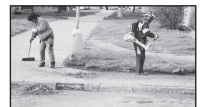
Pracovníci z Onzy zametají a čistí obrubníky.

Vtesali do kamene lásku, oddanost, touhu, žal, zoufalství, víru, naději... Když si prohlížím některé jejich sochy, nacházím to tam a mluvím ke mně. (ed)