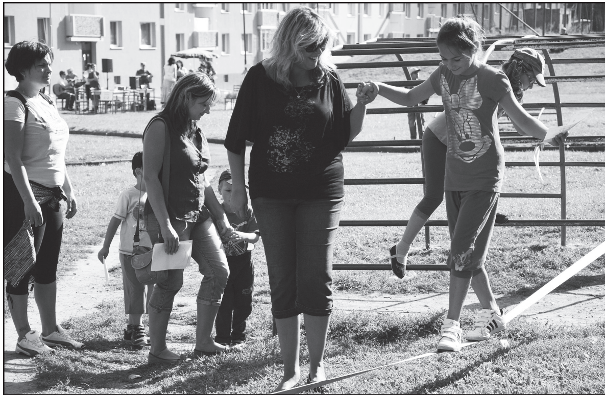
Chůze po laně, jednoduchá zábava, které se může věnovat každé dítě venku pod okny.