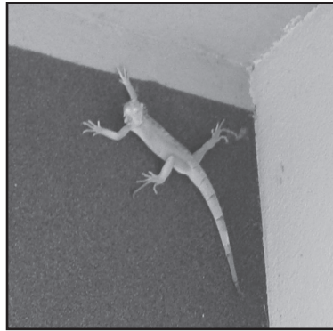
Leguán ve výklenku paneláku v Hornické ulici, vpravo již v bezpečí u strážníka.

prokázal požití alkoholu, u dívky dokonce změřil jedno promile! Pubertáči přiznali, kde alkohol koupili, takže strážníci je převezli domů k rodičům, informovali o tom sociální odbor a prodejci alkoholu hned udělili na místě pokutu. (ed)